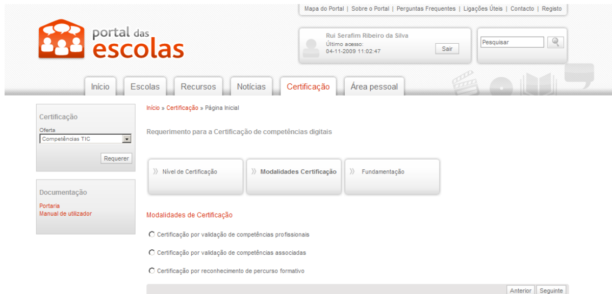
Ilustração 4 – Selecção da Modalidade de Certificação

Seleccionado o nível de certificação, o docente deverá optar pela modalidade de certificação pretendida, e premir o botão “Seguinte”.