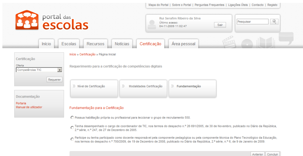
Ilustração 5 – Selecção da Fundamentação da Certificação

Seleccionada a modalidade de certificação, o docente deverá seleccionar a fundamentação pretendida, e premir o botão “Concluir Informação”.