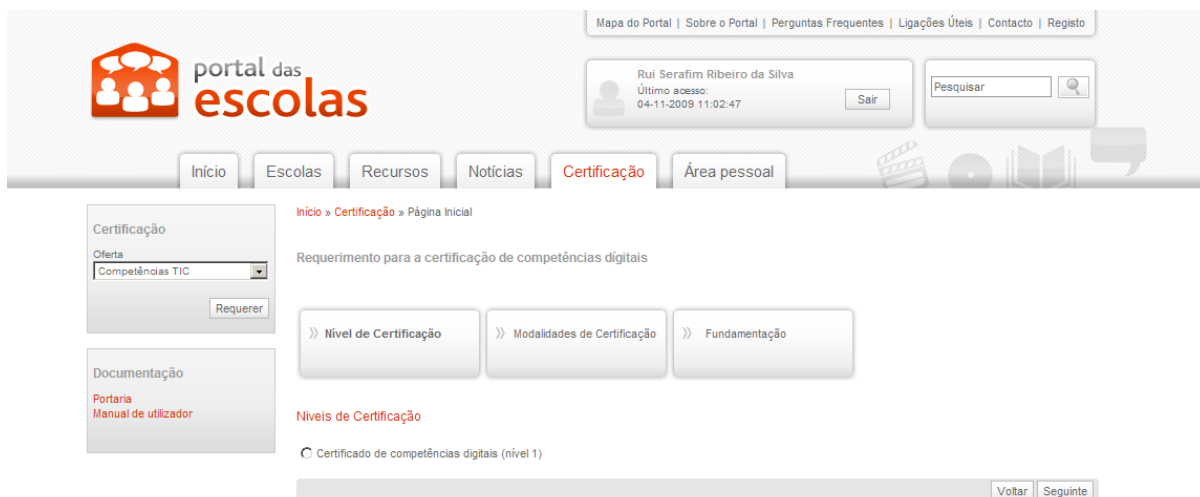
Ilustração 3 – Selecção do Nível de Certificação

Seleccionada a certificação pretendida, o docente terá de seleccionar o nível de certificação pretendido, e posteriormente premir o botão “Seguinte”.