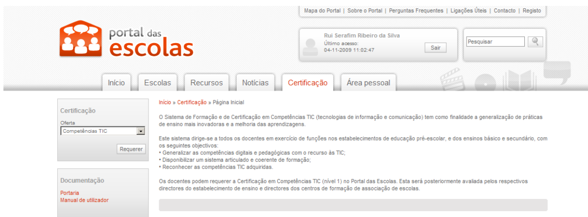
Ilustração 2 – Selecção da Certificação Pretendida

Após ter sido efectuada a autenticação no Portal das Escolas, o docente deverá seleccionar o separador certificação, tendo depois que escolher a oferta de certificação pretendida (Competências TIC) e premir o botão “Requerer”.