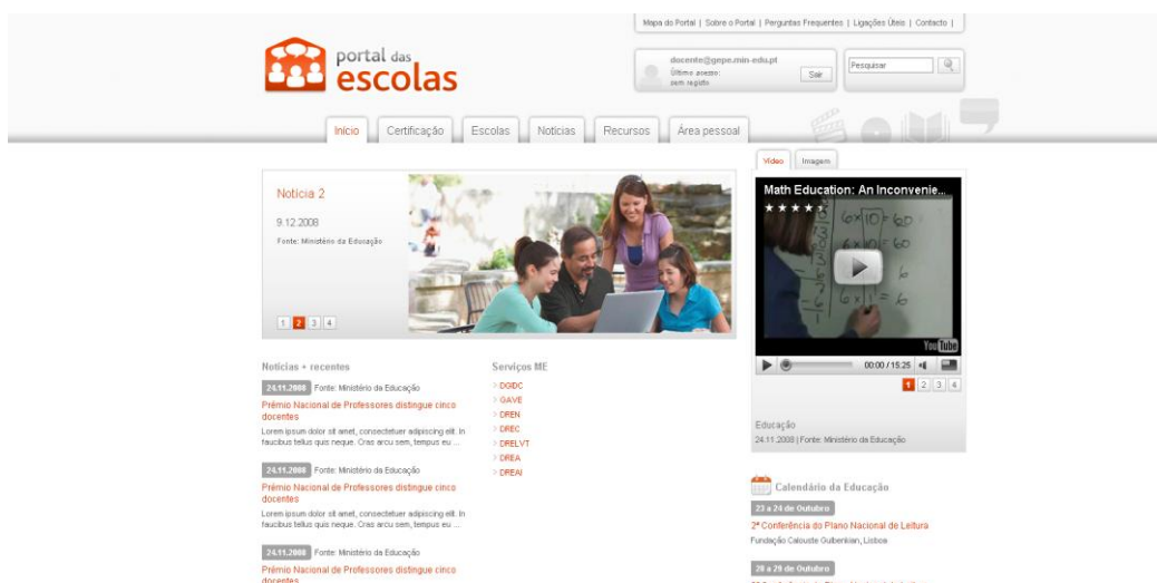
Ilustração 1 – Página de Autenticação

O docente deve autenticar-se no Portal das Escolas ( https://www.portaldasescolas.pt ) e seleccionar o separador “Certificação”.